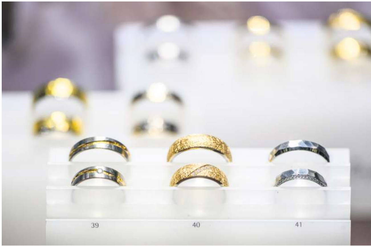
Wer heiratet, hat in der AHV einen Nachteil, aber auch mehrere Vorteile, von denen seltener die Rede ist.